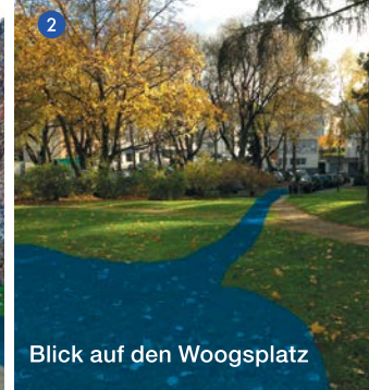
Blick auf den Woogsplatz